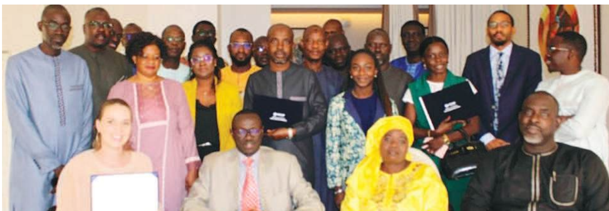
Atelier de formation des conseillers en Organisation sur la conduite du changement

européen de l'Administration publique et le BOM a permis l'intégration de la démarche qualité à travers l'outil CAF dans l'Administration publique.