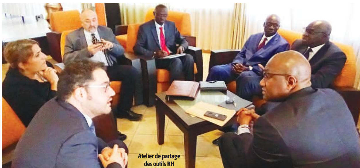
Atelier de partage des outils RH

Il a été également convenu, en 2017, un Memorandum of Understanding (M.O.U) avec la Coopération Sénégal-Luxembourg, portant sur l'accompagnement du processus d'institutionnalisation du contrôle de gestion dans l'Administration publique sénégalaise. Un cadre tripartite entre la Coopération Sénégal-Luxembourg, l'Institut