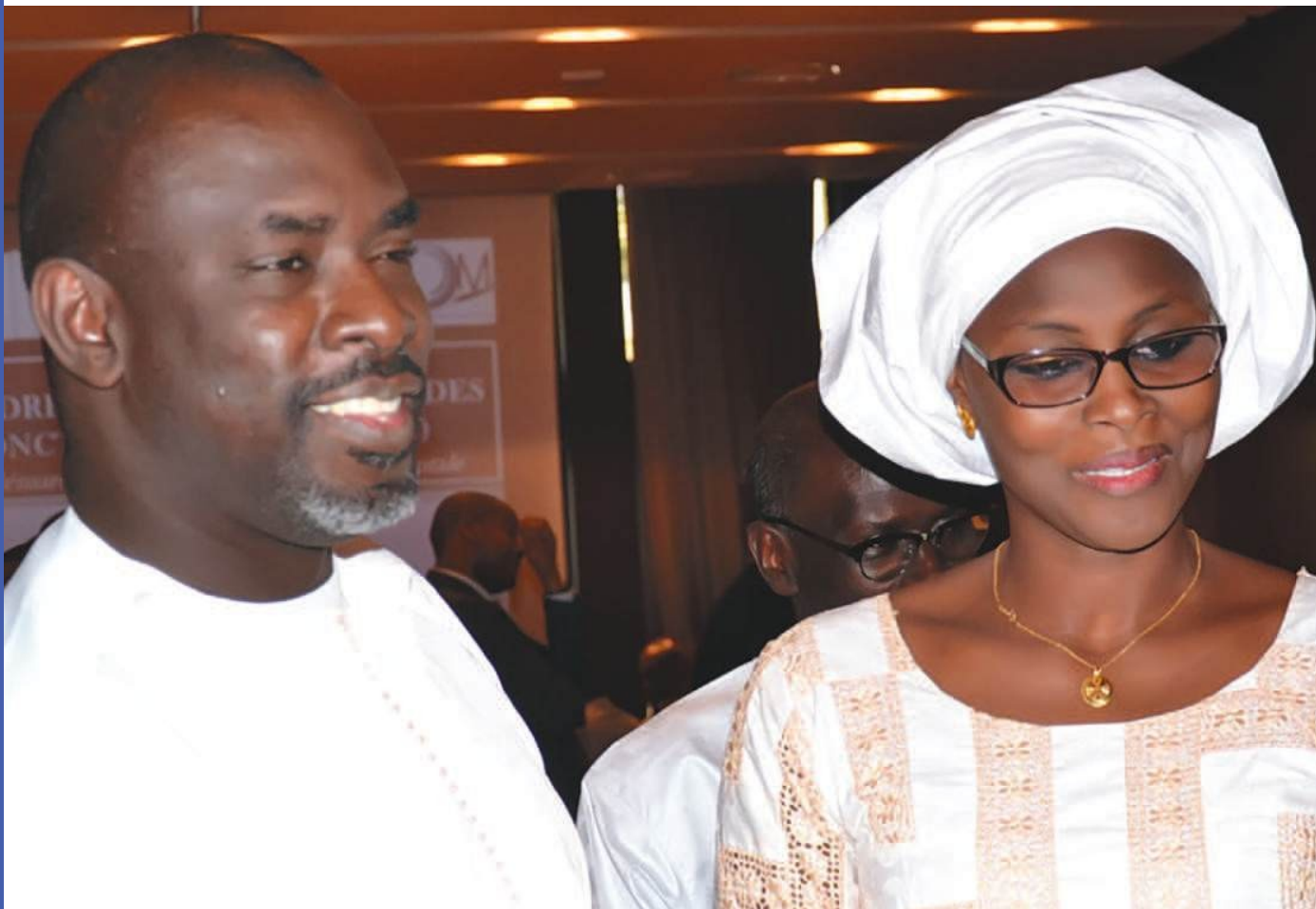
Atelier de vulgarisation du Cadre d'Autoévaluation des Fonctions publiques (CAF)

Depuis 2013, le BOM est revenu vers son appellation originelle avec comme ambition de promouvoir, dans l'administration publique, la culture de résultats, la culture de la qualité.