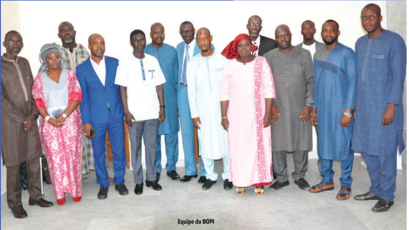
Equipe du BOM