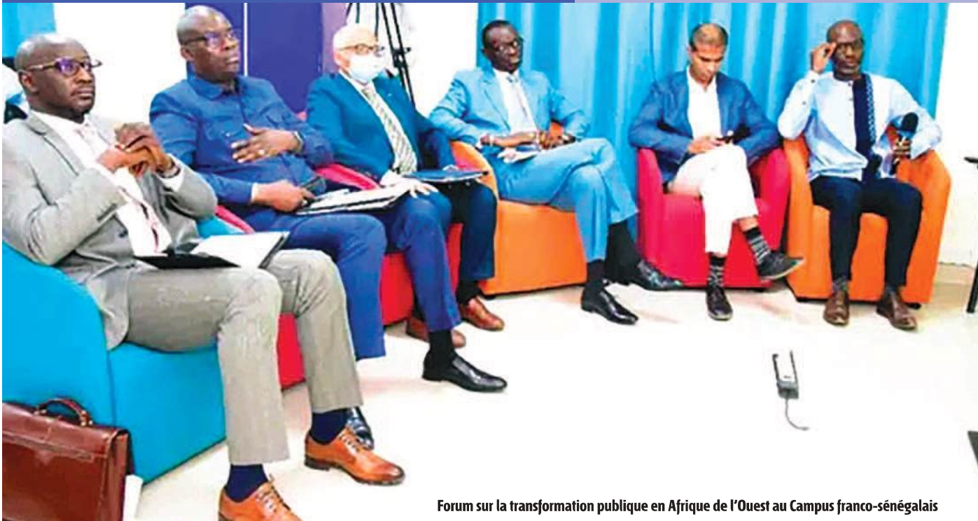
Forum sur la transformation publique en Afrique de l'Ouest au Campus franco-sénégalais

plus récentes sont les mutations de l'Agence de Presse sénégalaise (APS) et de l'Agence de Gestion du Patrimoine bâti de l'Etat (AGPBE) en sociétés.