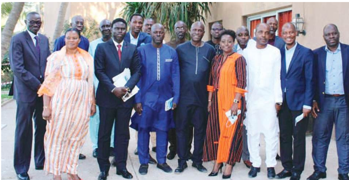
Atelier de formation des conseillers en Organisation sur l'Intelligence collective

A l'effet de mener à bien sa mission, le BOM se structure, outre le Service de Gestion et le Centre de Ressources, en trois pôles-métiers, à savoir le Pôle Conseil stratégique et Organisation de l'Administration publique, le Pôle Appui aux agences, aux sociétés et établissements publics et aux collectivités territoriales et le Pôle Renforcement des Capacités et Communication.